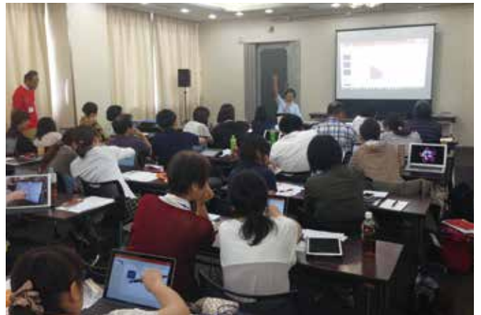
▲対面研修イメージ